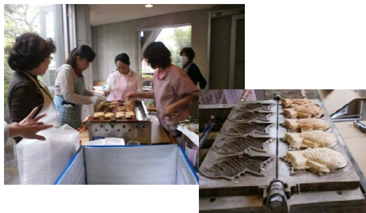
鯛焼き・大判焼き 調理中

あいにくの雨模様でしたが、よさこいソーラン「凜」の素敵な踊りを各階で披露していただき、目の前で鑑賞することができ、利用者の方たちも喜んでいました。各階での小運動会では利用者ご家族も参加し、特に子どもたちの参加では楽しい笑顔や歓声でにぎやかなひと時を楽しんで頂くことができました。おやつには手作りの鯛焼きや大判焼きで利用者の方たちは昔を懐かしんでおられました。