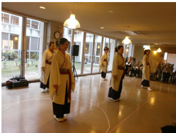
みのおよさこい踊り子隊 凜