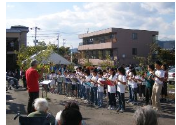
《 箕面市少年少女合奏団の演奏 》