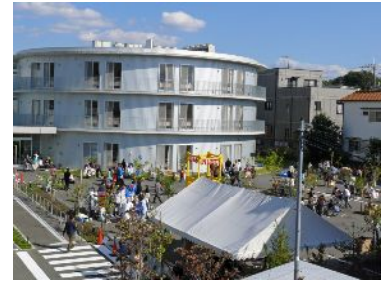
《 秋祭り会場の異今宮病院 》

異病院(石橋)から異今宮病院行きのシャトルバス(無料)も運行しています。皆様のご来場を異今宮病院のスタッフはもちろん、異病院のスタッフも心からお待ちしていますのでぜひお越しください。