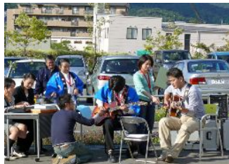
《 職員有志によるバンド演奏 》