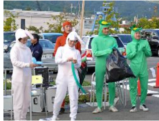
《 バルーンアート 》